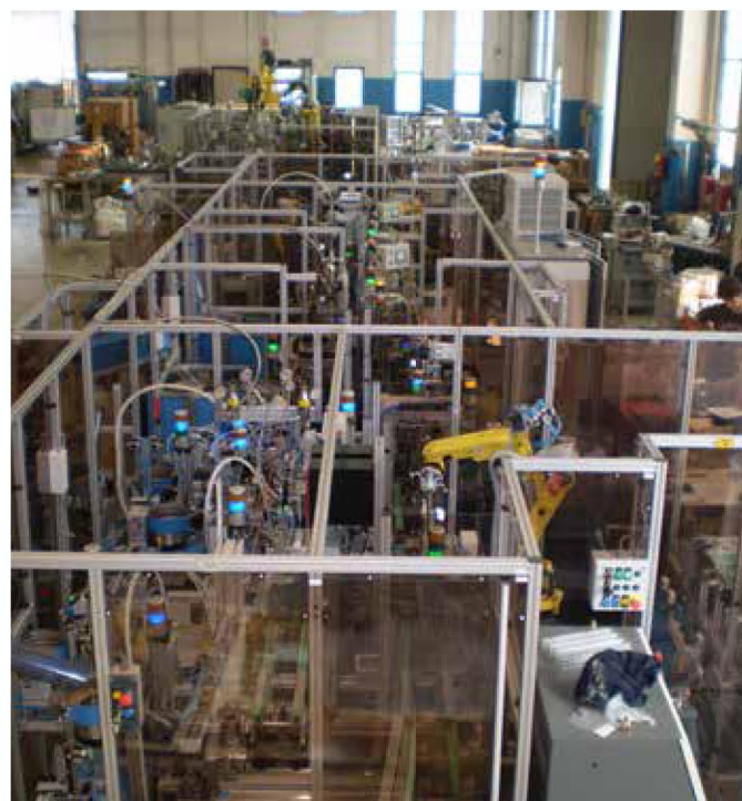
linea robotizzata montaggio, collaudo e taratura rubinetti gas per cucine